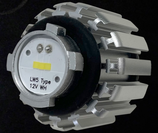
交換用ハイパワーバルブ LW5タイプ